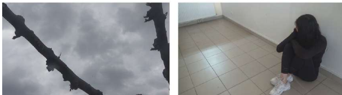
Photogrammes issus du court-métrage Coat